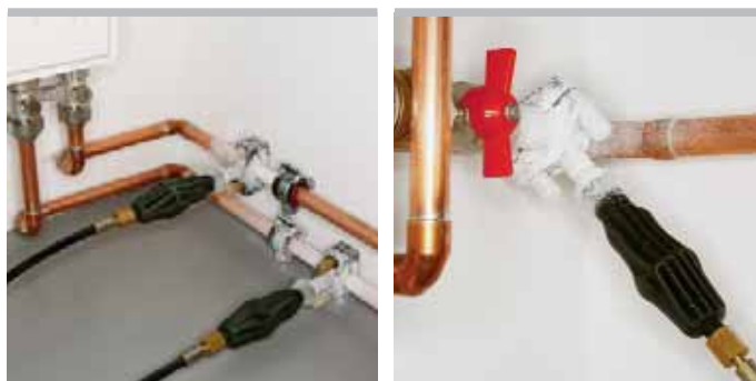
Kvalitní německý výrobek